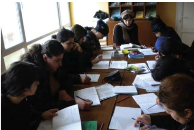
ინგლისური ენის გაკვეთილზე Course in English Language