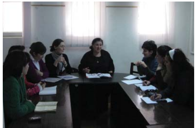
რუსული ენის გაკვეთილზე Russian language course