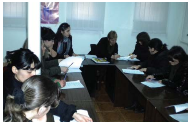
ბუღალტერიის კურსებზე Course in Accounting