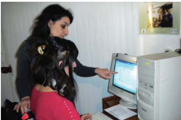
კომპიუტერის კურსებზე Course in Computers

Upon completion of the course girls will be able to work on computers easily in case of employment, which is very good opportunity for them.